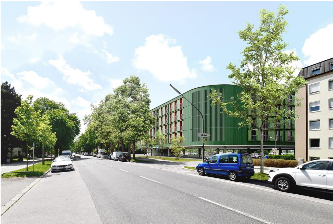
Die GEWOFAG-Parkplatzüberbauung am Reinmarplatz (Visualisierung: Florian Nagler Architekten)

Frank De Gasperi, Konzernsprecher GEWOFAG Holding GmbH Tel.: (089) 4123-372 E-Mail: frank.de-gasperi@gewofag.de www.gewofag.de