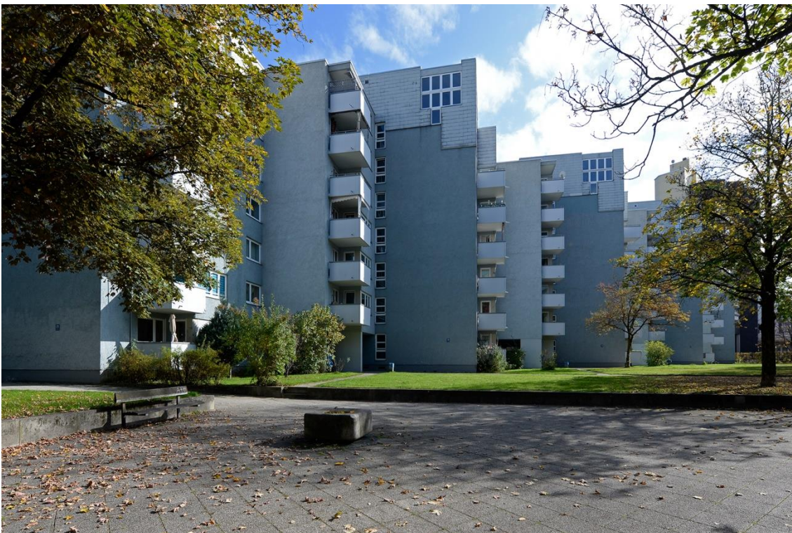
Blick auf die Westseite der GEWOFAG-Wohnanlage am Karl-Marx-Ring.

Frank De Gasperi, Konzernsprecher GEWOFAG Holding GmbH Tel.: (089) 4123-372 E-Mail: frank.de-gasperi@gewofag.de www.gewofag.de