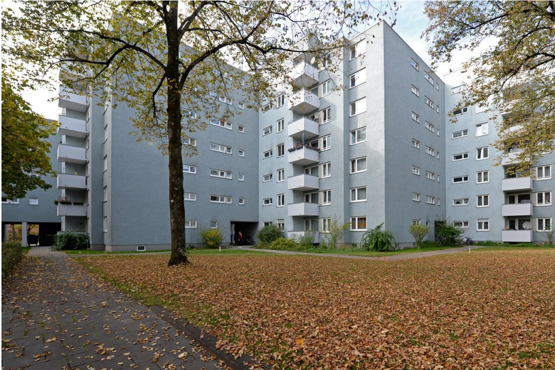
Die GEWOFAG-Wohnanlage am Karl-Marx-Ring von Osten gesehen.