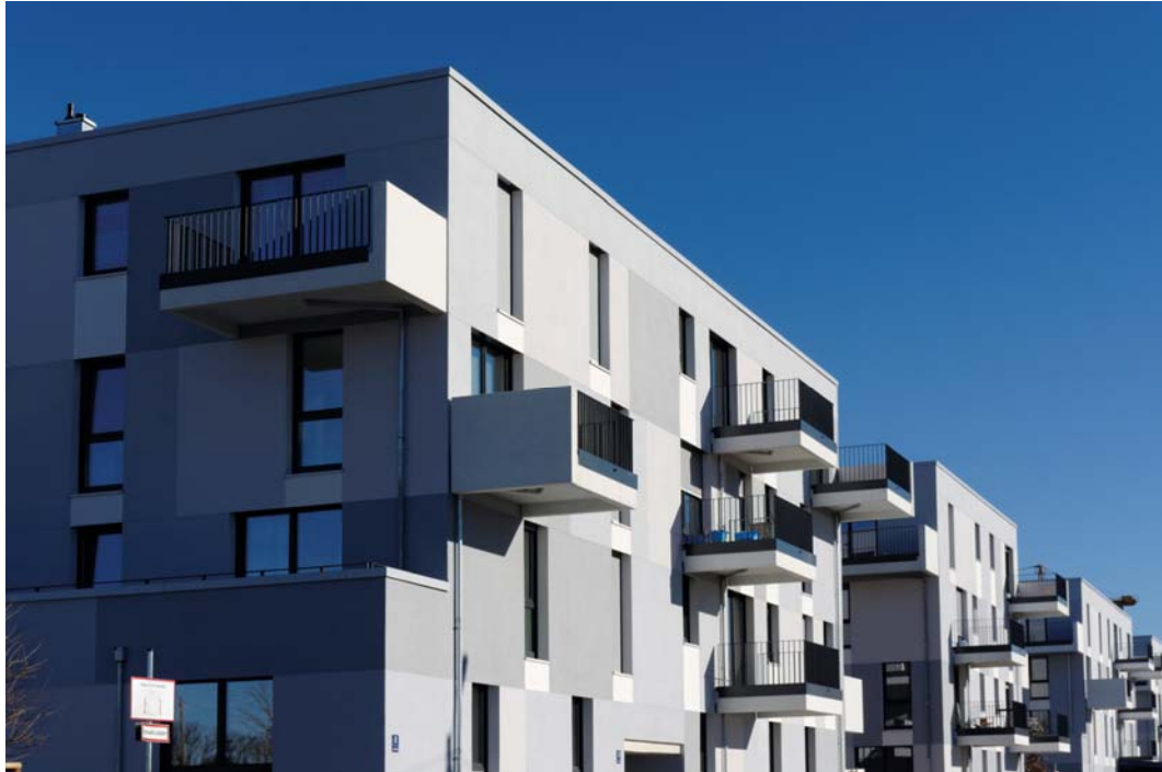
Ansicht von Westen.