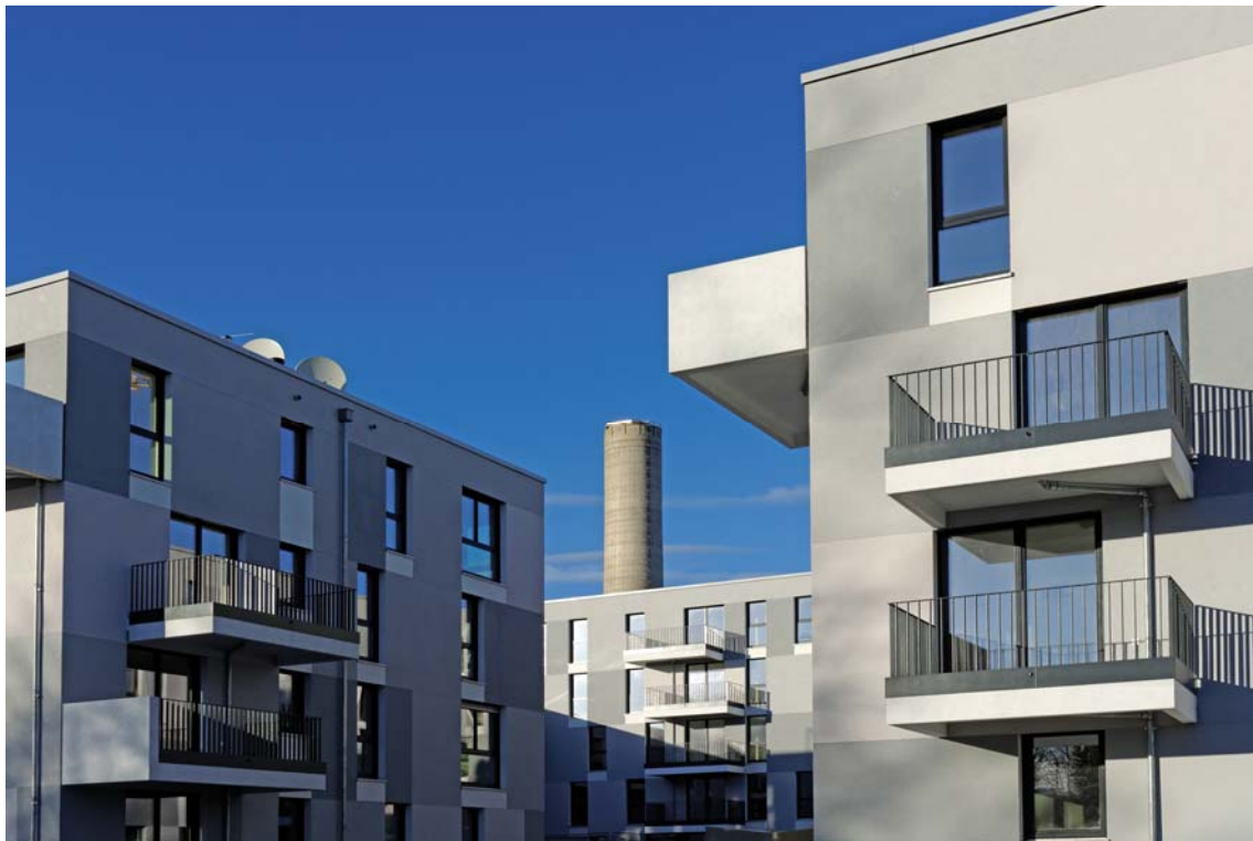
Gebäudegruppe GEWOFAG-Bauvorhaben Domagapark.

Der Deutsche Bauherrenpreis dient der Förderung innovativer Lösungen im Wohnungsbau. Dabei wird dem Verhältnis zwischen hoher Qualität und tragbaren Kosten besondere Beachtung geschenkt. Der Deutsche Bauherrenpreis ist der erfolgreichste Wettbewerb seiner Art in Deutschland. Ausgelobt wird er durch die Arbeitsgruppe KOOPERATION des GdW Bundesverband deutscher Wohnungs- und Immobilienunternehmen, des Bundes Deutscher Architekten BDA und des Deutschen Städtetages (DST).