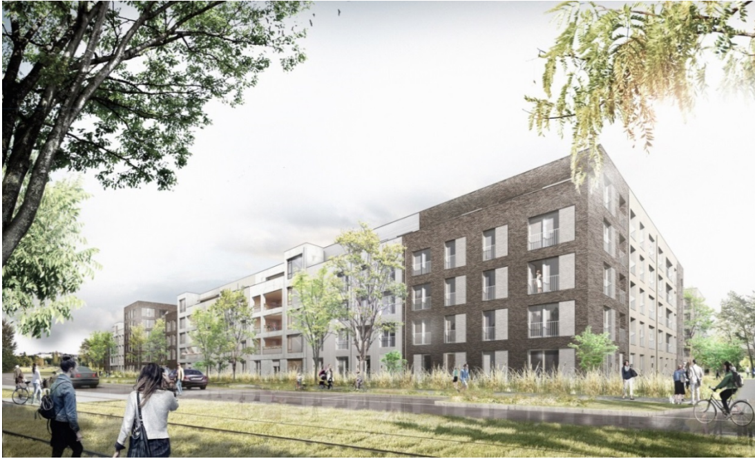
Ansicht des WA 2 (im Vordergrund) und WA 1 (hinten links) von der Cosimastraße (Visualisierung: ARGE AllesWirdGut Architektur und wup_wimmerundpartner)