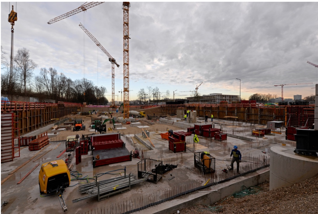
Baustelle WA 1