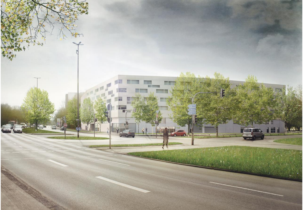
Fassadenansicht vom Innsbrucker Ring aus